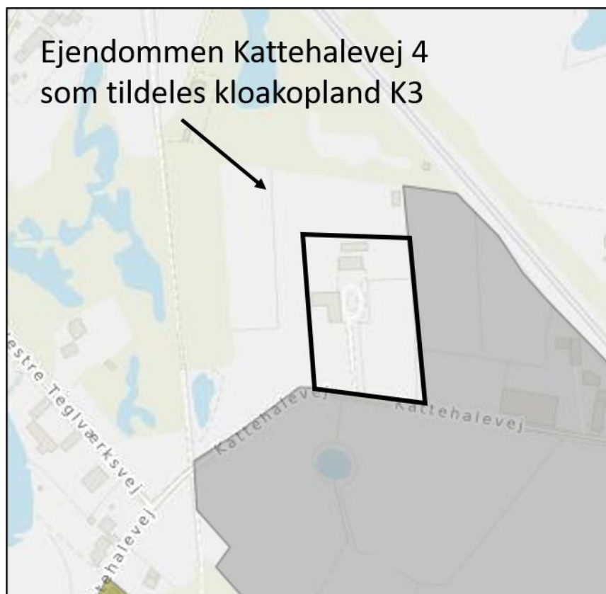
Figur 2 Afgrænsning af nyt kloakopland K3

Ejendommen Kattehalevej 4 tildeles betegnelsen kloakopland K3. Det afgrænsede kloakopland udgør kun den bebyggede del af matr.nr. 10cn Blovstrød by, Blovstrød.